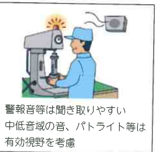
警報音等は聞き取りやすい中低音域の音、パトライト等は有効視野を考慮