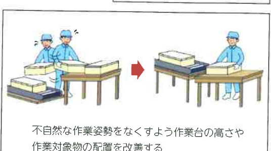
不自然な作業姿勢をなくすよう作業台の高さや作業対象物の配置を改善する

注：申請内容の確認のため、（一社）労働安全衛生コンサルタント会が実地調査を行うことがあります