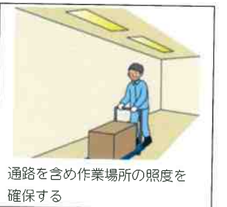
通路を含め作業場所の照度を確保する