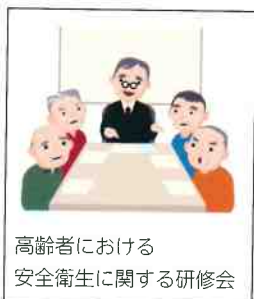
高齢者における安全衛生に関する研修会