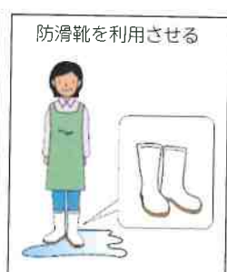
防滑靴を利用させる