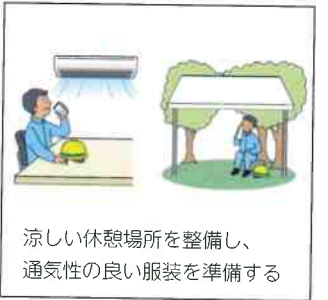
涼しい休憩場所を整備し、通気性の良い服装を準備する