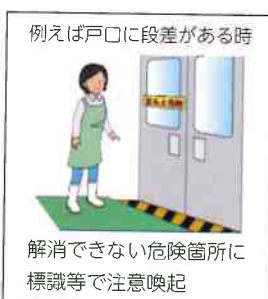
例えば戸口に段差がある時 解消できない危険箇所に標識等で注意喚起