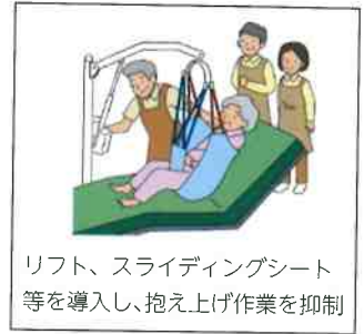
リフト、スライディングシート等を導入し、抱え上げ作業を抑制

※労働者個人ごとに費用が生じる対策（ウェアラブルデバイス、防滑靴、体力チェックなど）については、雇用する高年齢労働者の人数分に限り補助対象とします